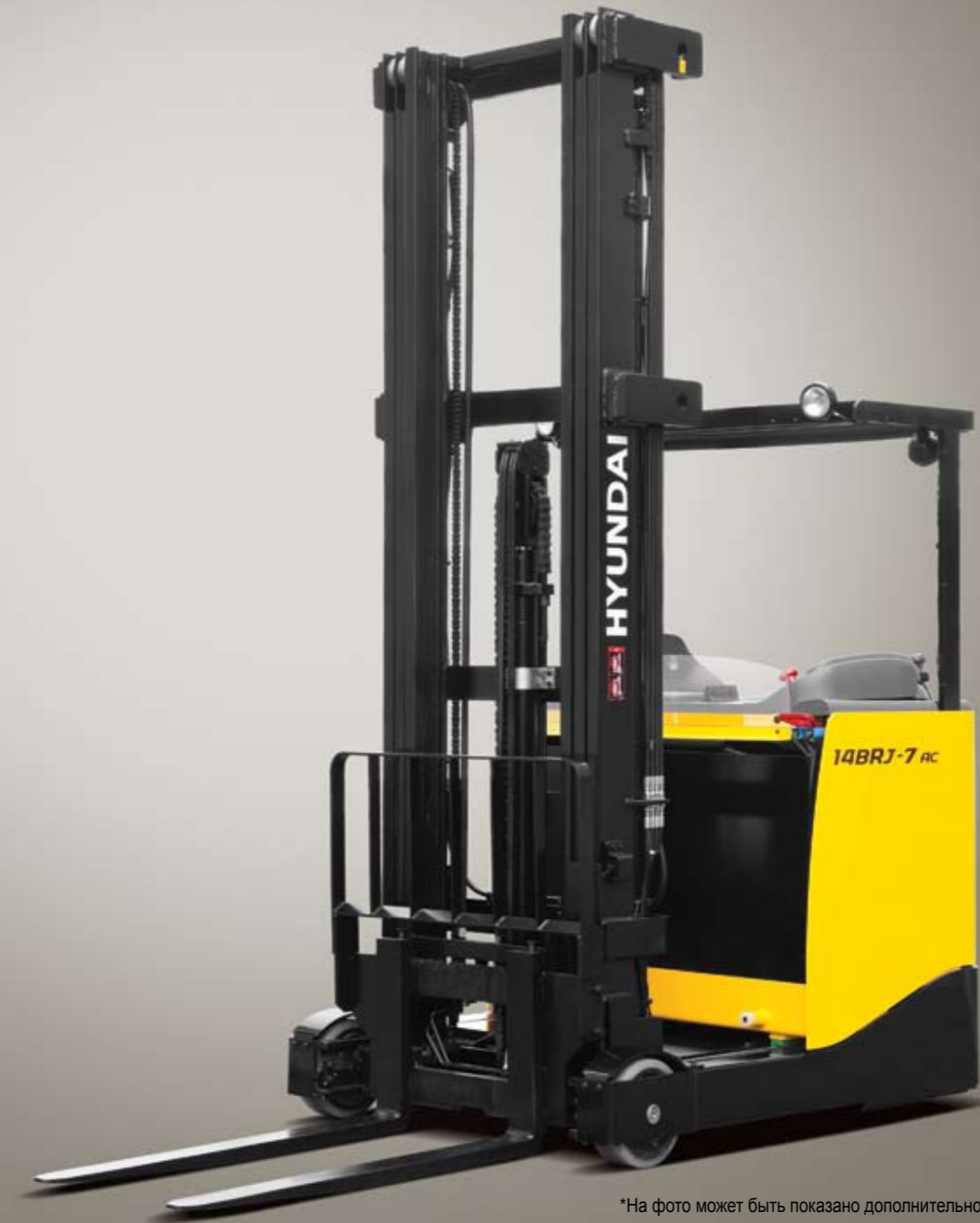
*На фото может быть показано дополнительное оборудование.

ВИЛОЧНЫЕ ПОГРУЗЧИКИ Экологически безопасны