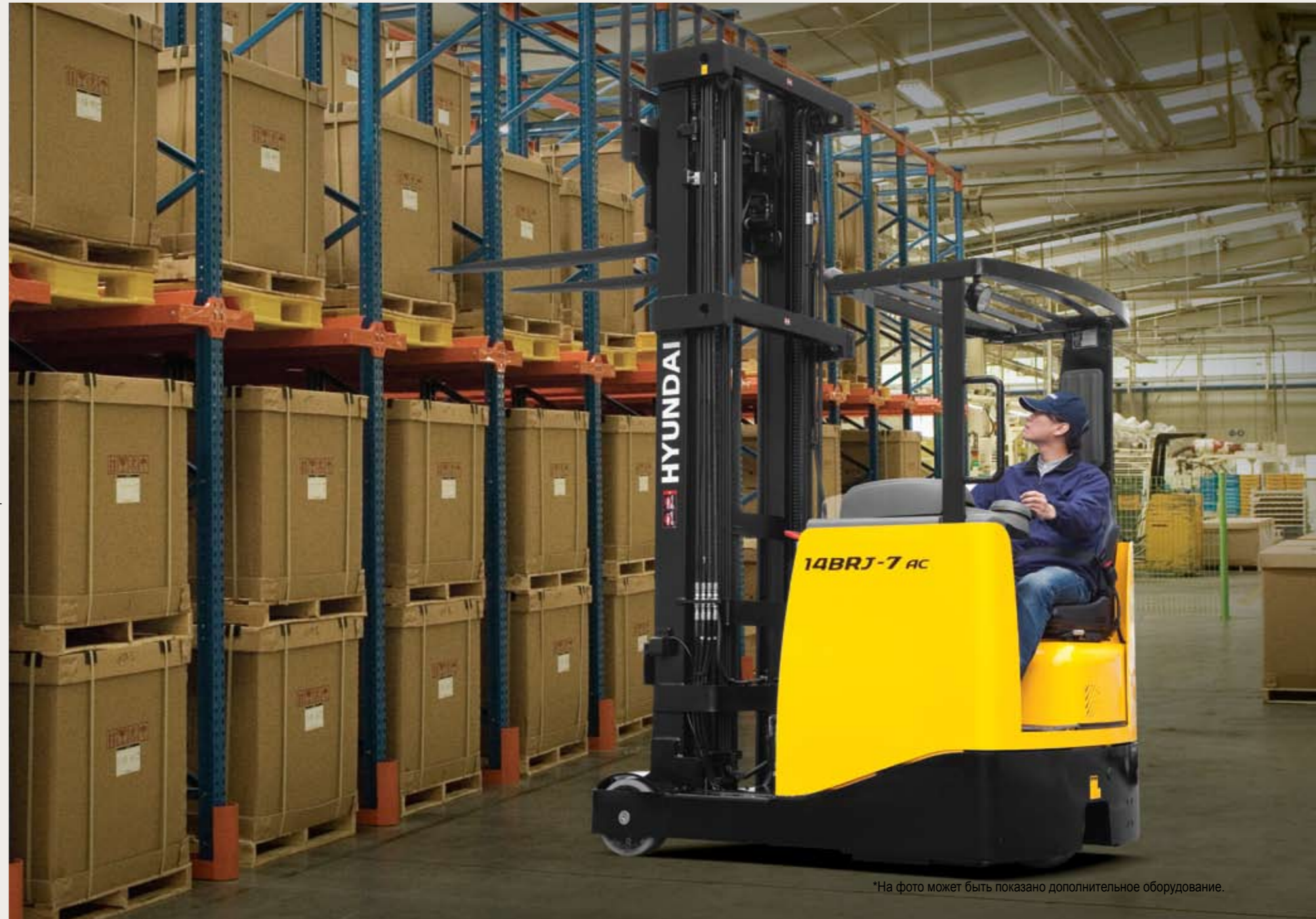
*На фото может быть показано дополнительное оборудование.

Компактный дизайн, подходящий для работ в узких проходах, гарантирует эффективную производительность и максимальное использование пространства.