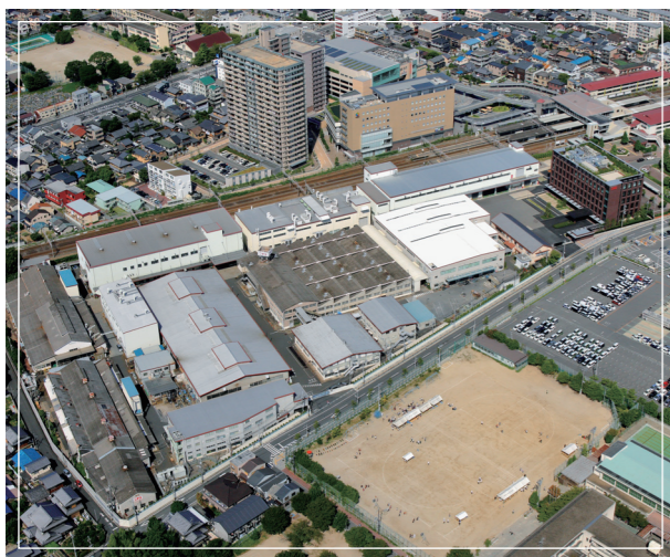
Завод в Киото, Япония